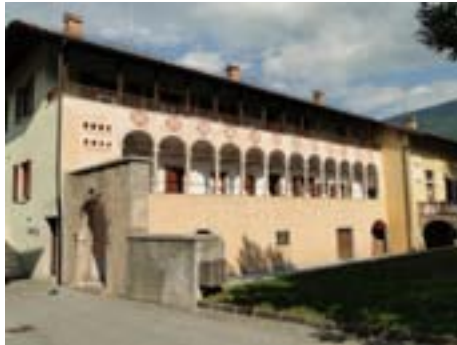
La sede dell'Associazione all'ex Municipio di Campo Lomaso

Brogliato, arricchita dalla presenza di materiali di un tempo prelati dal Museo della Scuola di Rango e dall'Associazione Stenico 80 G. Zorzi. Ricerca e mostra poi continuata anche negli anni successivi a Stenico e S. Lorenzo in Banale. Grande collaborazione è stata ed è, quella alla creazione, assieme al Circolo culturale Stenico 80 "Giuseppe Zorzi", dell'esposizione permanente della "Collezione etnografica giudicariese Par Ieri" presso le sale della Casa della Comunità di Stenico, proprio sotto il castello. Diverse pubblicazioni hanno accompagnato le ricerche del gruppo che purtroppo va via via assottigliandosi per la mancanza di un avvicendamento generazionale. In attesa di ciò che riserverà il futuro, sottolineiamo la grande opera portata avanti per cinquant'anni